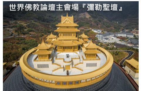
世界佛教論壇主會場『彌勒聖壇』

彌勒聖壇主要景點包括大慈門、未來廣場、彌勒藝術博物館、大慈吉祥寶殿、時光甬道、萬善堂、須彌山、兜率天宮等。