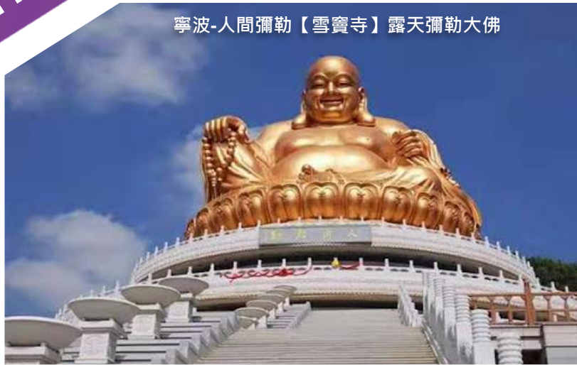
寧波-人間彌勒【雪竇寺】露天彌勒大佛

※ 專業貼心服務-全程食住安排妥善、預留充足自由活動時間令團友盡情享受 ※ 【當地專屬配車·由經驗充足的服務人員同行下，讓您體會一個舒適安心的旅程】